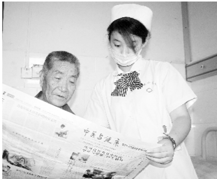
郑县中医院病房,住院患者正在聚精会神地阅读院报。

医院文化是凝聚人才的纽带,是医院活力的源泉。一些基层医院由于客观条件的限制,医院文化建设相对滞后。尽管如此,还是有相当多的基层医院,面对当前卫生资源投入向基层医院倾斜的大好局面,充分利用这一契机,大力推进医院文化建设,使得医疗质量、管理水平、医院收入等方面有了较大幅度提高,他们的经验值得广大基层医疗机构借鉴。